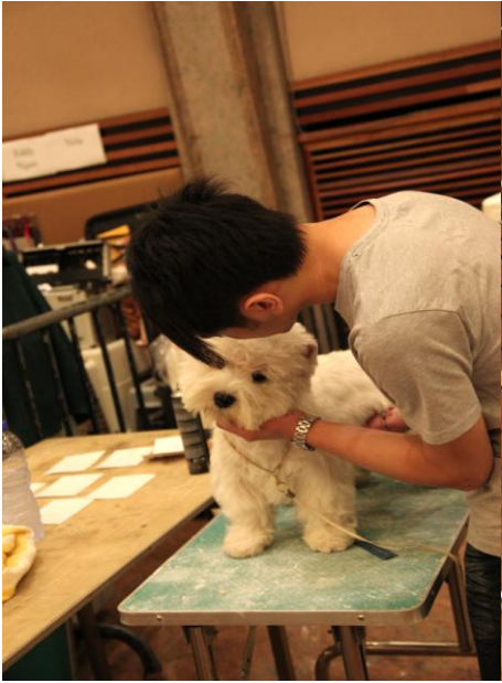
主人好細心幫愛犬扮靚靚