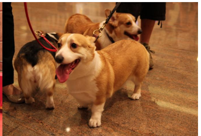
拜拜啦! 下次再見啦!