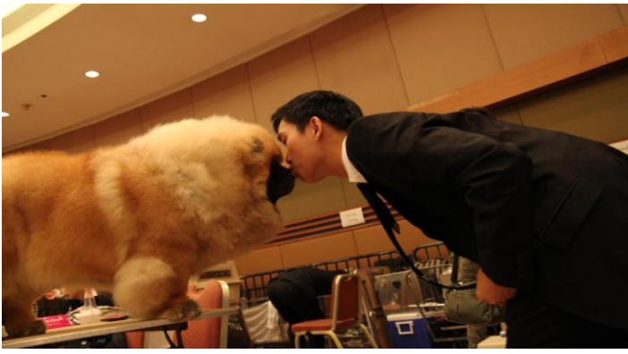
好溫馨的場面!愛犬出場前主人深吻一下比鼓勵愛犬!