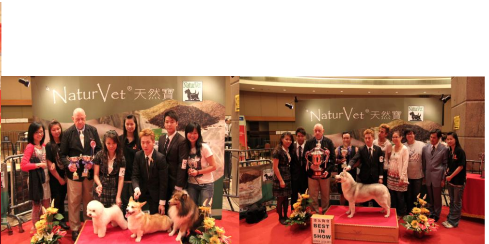
得獎的犬隻與裁判大合照